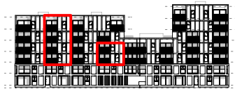
gevel west - kanaalzijde