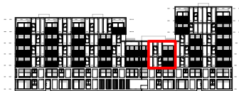
gevel west - kanaalzijde