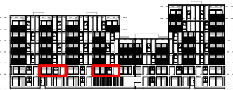
gevel west - kanaalzijde